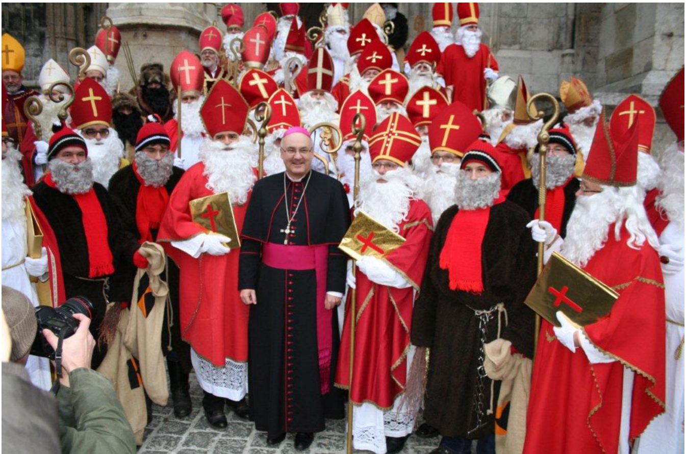
Nikolausabordnung der KF Alteglofsheim mit Bischof Rudolf Voderholzer.

Nikoläuse durch die Innenstadt zogen. Nikolausdienste haben in vielen Kolpingsfamilien eine lange Tradition. Das erfordert intensive Vorbereitungen und eine aufwändige Logistik. Dieses Engagement wollten der Diözesanverband und Diözesanpräses Stefan Wissel würdigen und luden zum Nikolaus-Gipfel